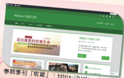
學院季刊「牧蹤」： https://hsteps.blog/ 電子化及加入互動元素