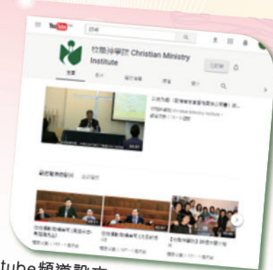
Youtube頻道設立： https://goo.gl/tCgPzr 分享學院影音資訊