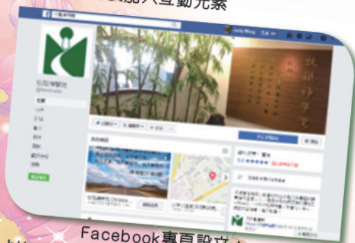
Facebook專頁設立： https://www.facebook.com/hkcmi.edu/ 最新資訊及神學分享