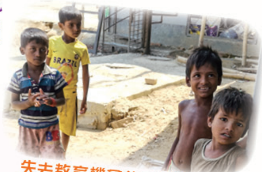
失去教育機會的孟加拉街童