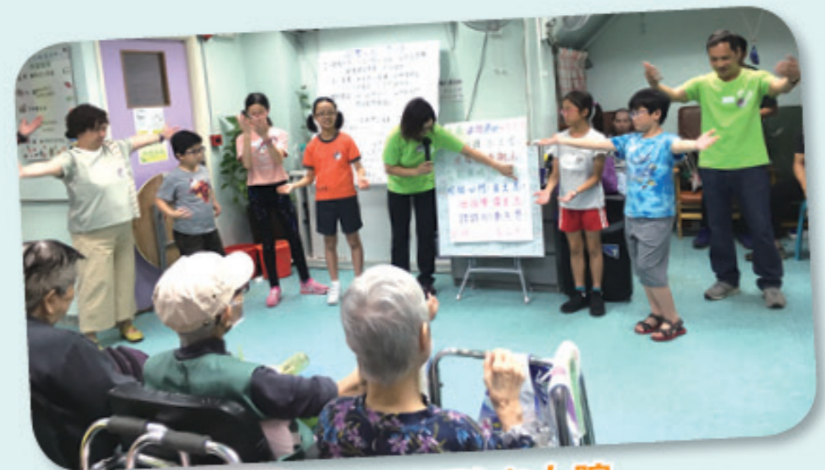
一家大小探訪老人院