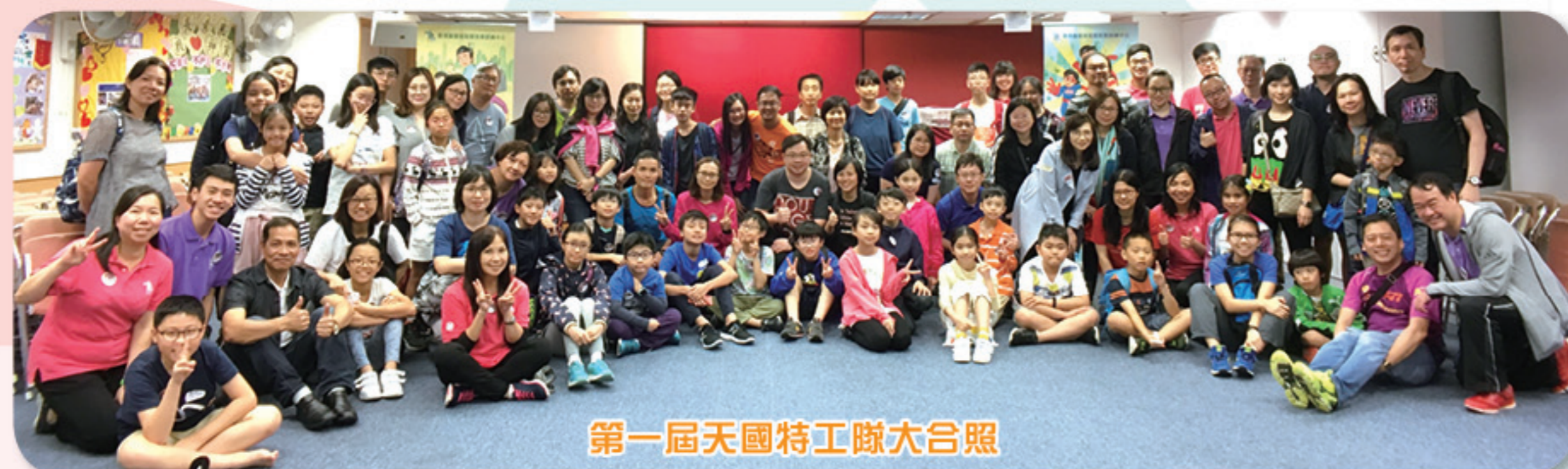
第一屆天國特工隊大合照