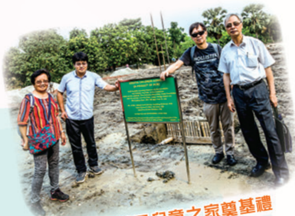
孟加拉華恩兒童之家奠基禮