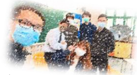
青少年聯堂直播，感謝其他堂會仗義幫助。