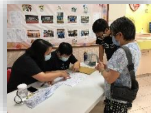
社區福音：派發飯券、口罩等物資

全年封數： 887 封 全年總收入： 2,155,704 全年總支出： 1,933,655 盈餘： 222,049 常費結存： 444,466 建堂基金： 200,220