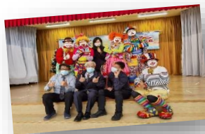
網上直播「好好丑丑」佈道會