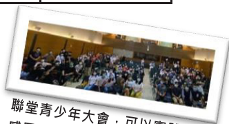
聯堂青少年大會，可以實體，超感恩。