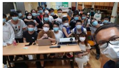
同行 Teen 地 2020