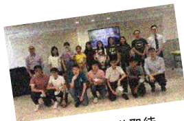
深區門訓：俗世聖徒