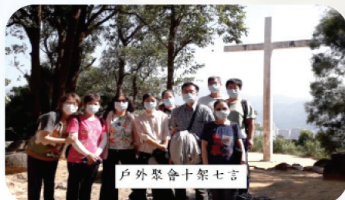
戶外聚會十架七言