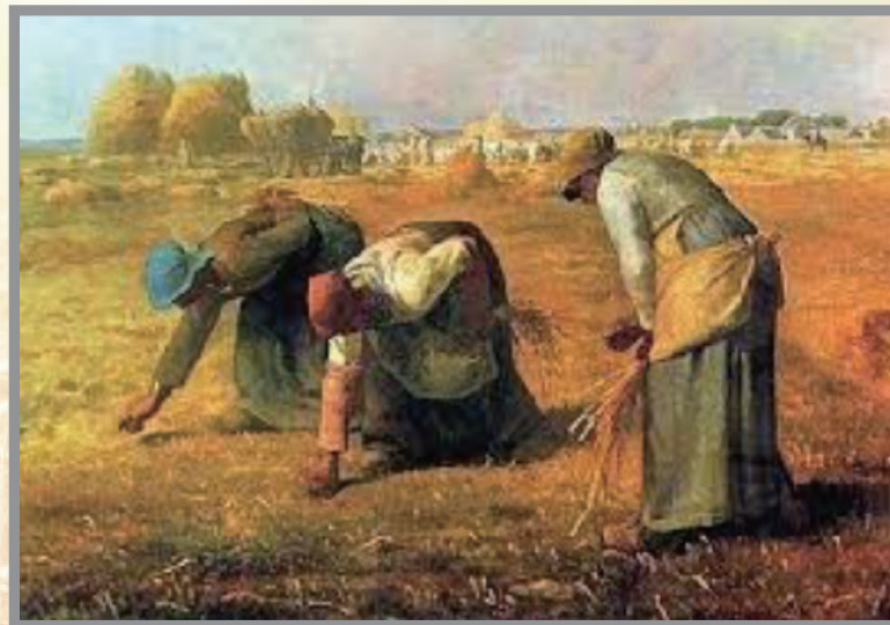
米勒名作《拾穗者》，1857年

弱姝拾穗近親田 2 ，美德勤勞倍見憐。 返自外邦苦不怨，經營國內富稱賢 3 。 慨慷義守贖遺業 4 ，深摯情投締美緣。 同邑感恩證盛事，人間萬代愛綿延 5 。