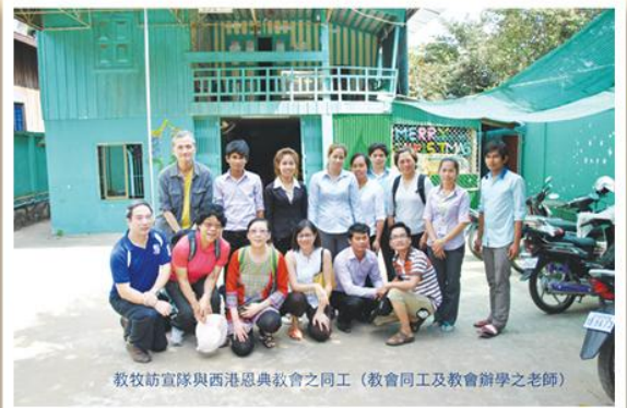
教牧訪宣隊與西港恩典教會之同工（教會同工及教會辦學之老師）