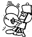
主日聚會及祈禱會負責人